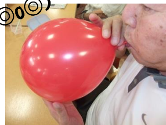
風船を膨らませます。