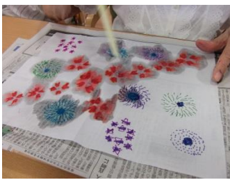
模様にストローで水をたらしにじませます。