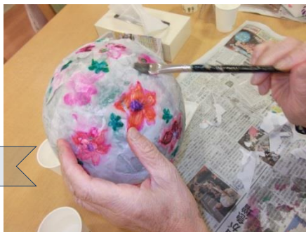
模様の半紙を重ねて貼る。